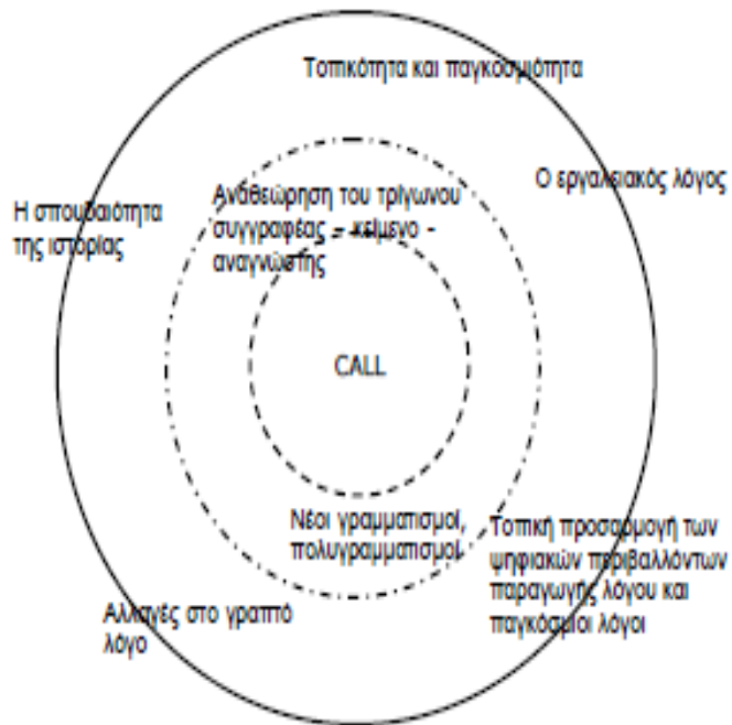
Σχήμα 1. Η μεταφορά των τριών κύκλων