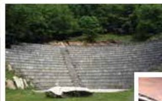
στο αρχαίο θέατρο